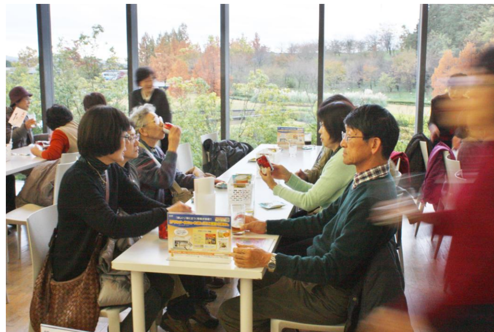
待望のアサヒビール試飲。カメラも手ふれ