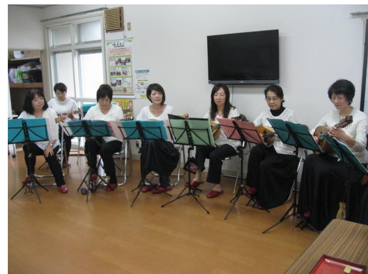
「トレアド」の皆さんの演奏を聞きながら会食