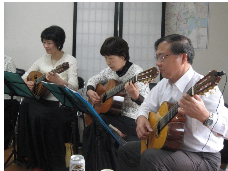
「トレアド」の皆さんの演奏