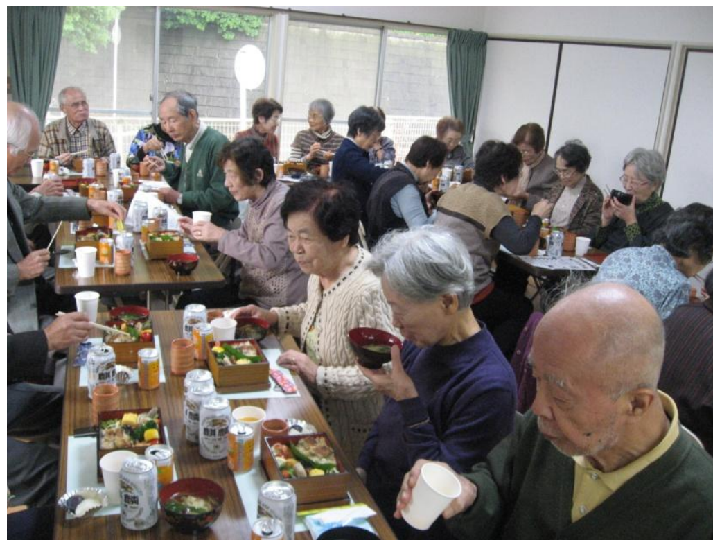
福祉部委員の手作りの昼食