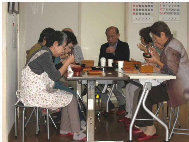
福祉部の皆さんもお相伴