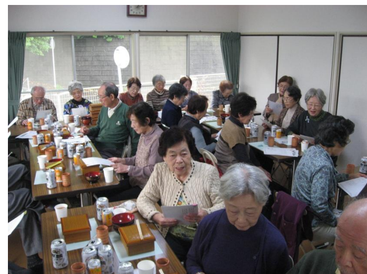
マンドリンの伴奏で合唱