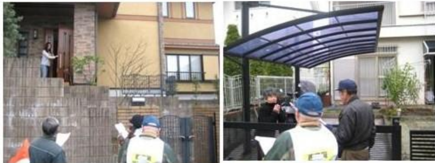
協力頂いたお宅に安否確認訪問 問題なし