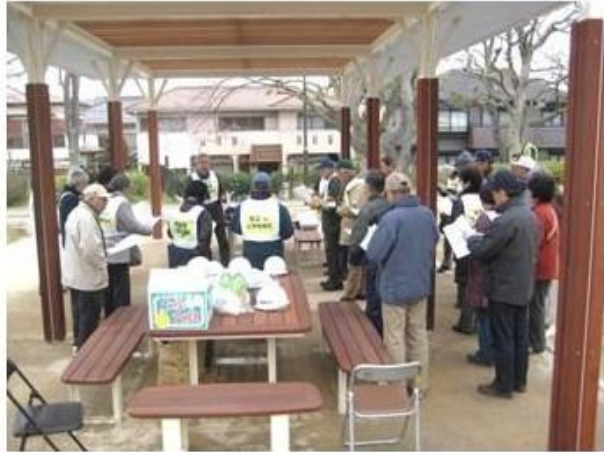
訓練の打ち合わせ