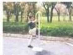
遊具広場ストレッチ