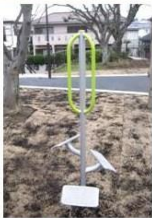
下半身のストレッチ