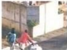
入口新築壁の勾配