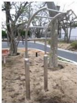
ぶらさがりで姿勢を矯正