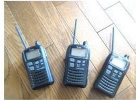
本部との連絡に用いたトランシーバー