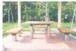
バリアフリータイプのピクニック