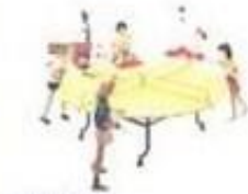
バレーコート (屋内)