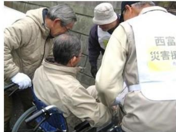
安否確認 問題発生