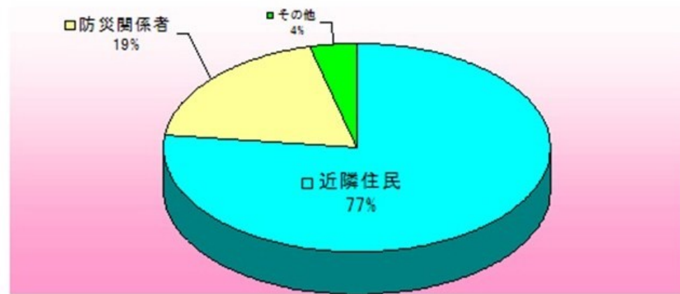
自力脱出困難者約35,000人のうち

---3月11日の東日本大震災を経験し、更に強い余震の発生を想定して、4月24日、西富岡災害援護隊が集まり、次の強い地震に備えて、安否確認手順、避難方法などを話し合いました。参加した人員は、西富岡災害援護隊員41名、富岡地域ケアプラザ1名、計42名でした。---