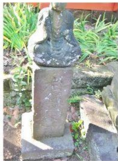
龍華寺に残る道標 「左保土ヶ谷」