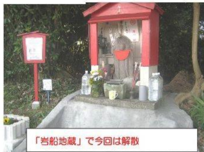
「岩船地藏」で今回は解散