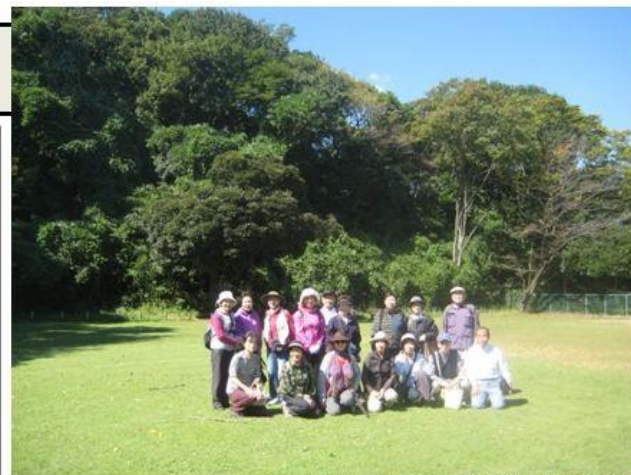
富岡総合公園 で休憩