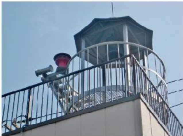
谷津の喚鐘(1745年能見堂に寄進された鐘)