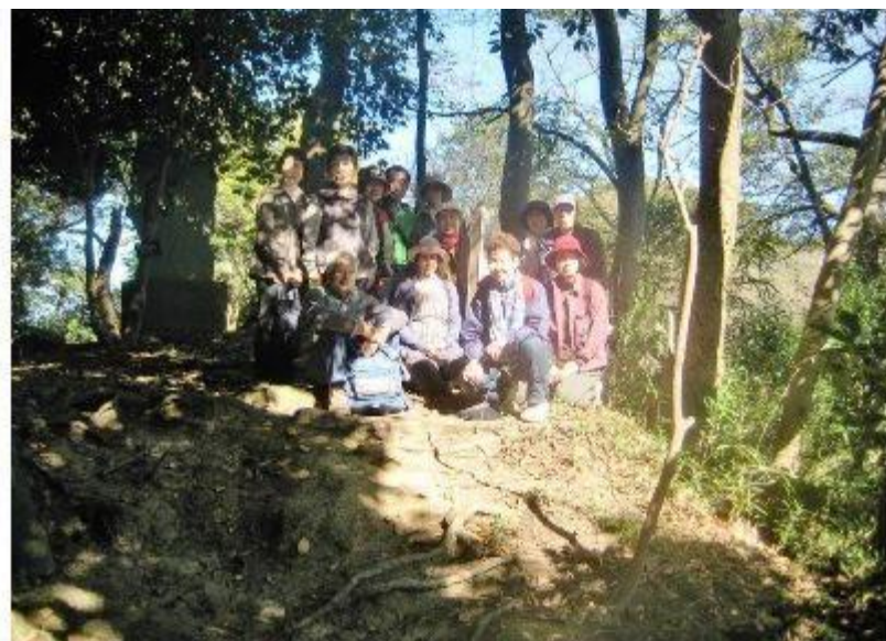
能見堂跡で記念撮影