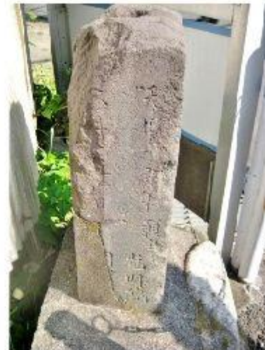
谷津の道標(保土ヶ谷道(金沢道)と白山道の分岐点にあった道標)