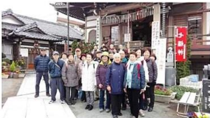
一番目の正法院で全員の記念撮影