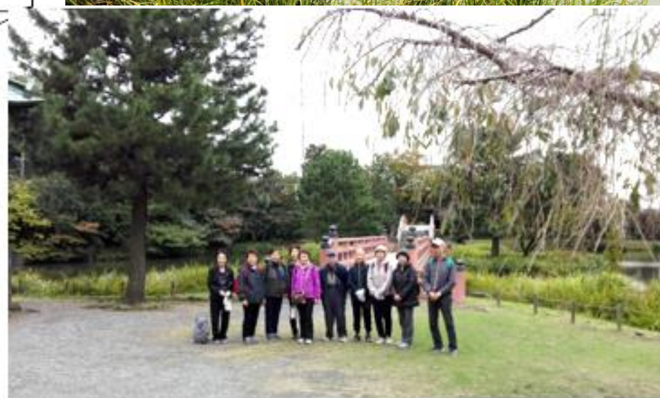
山道ウォーキング