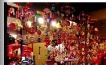
北鎌倉古民家ミュージアム