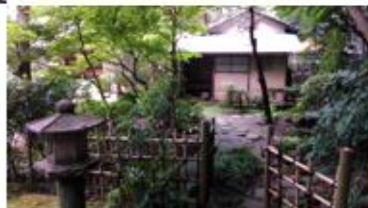
茶室「城山庵」(如庵) 記念撮影。