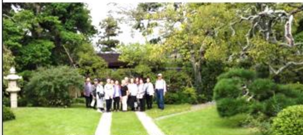
兜門の前で全員の記念撮影。

月日 平成28年10月5日(水) 13名が参加しました 9時30分能見台駅を出発し、目的地に10時50分到着 旧吉田茂邸地区見学 2つのグループに分かれ、各々ガイドさんに説明 を受ける。12時～12時45分、管理休憩棟で昼食休憩。 その後、旧三井別邸地区の茶室「城山庵」(如庵)を見学し、13時30分 帰途につきました。今回のウォーキングは約9,000歩でした。