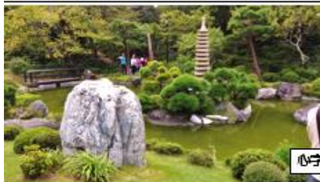
心字池にうっとり。