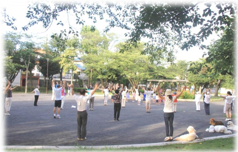
ラジオ体操 富岡第五、第七公園