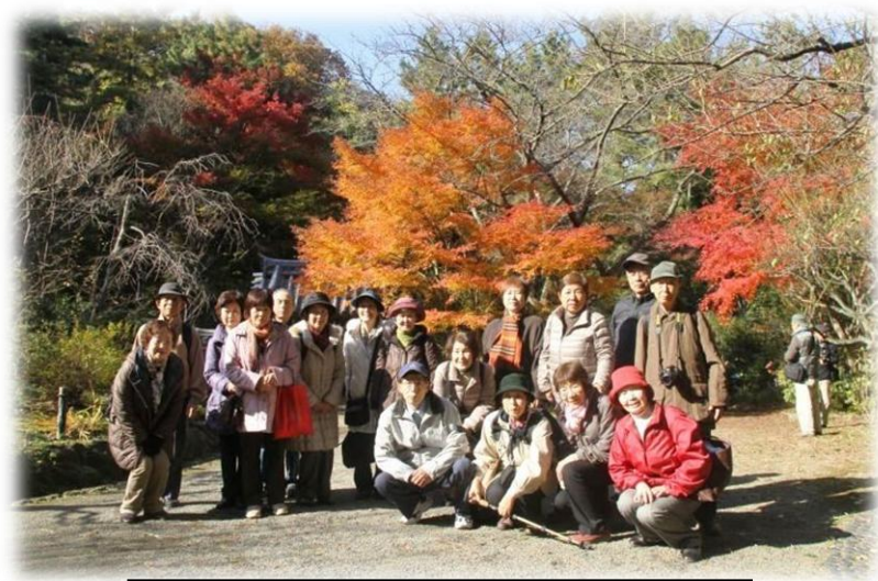
ウォーキングハイキング さんぽの会