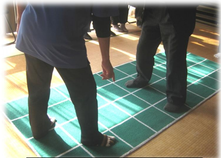
富岡ケアプラザ主導の健康づくり教室