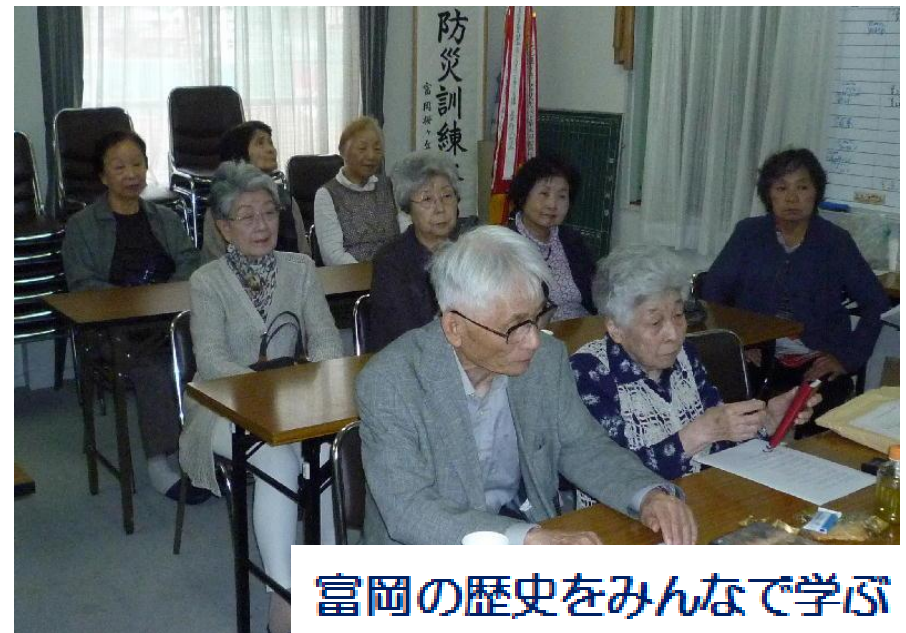
富岡の歴史をみんなで学ぶ