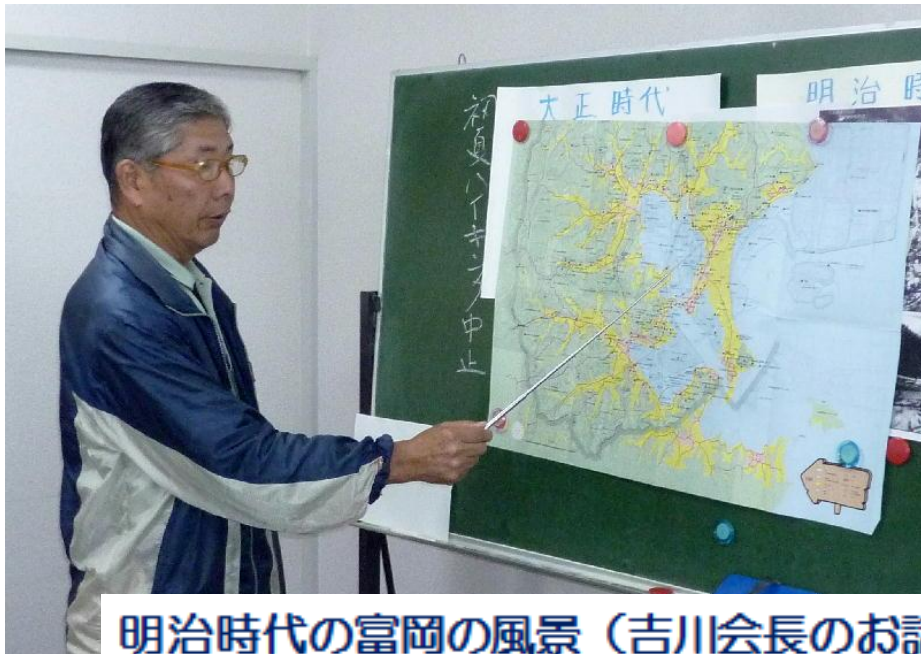
明治時代の富岡の風景（吉川会長のお話）