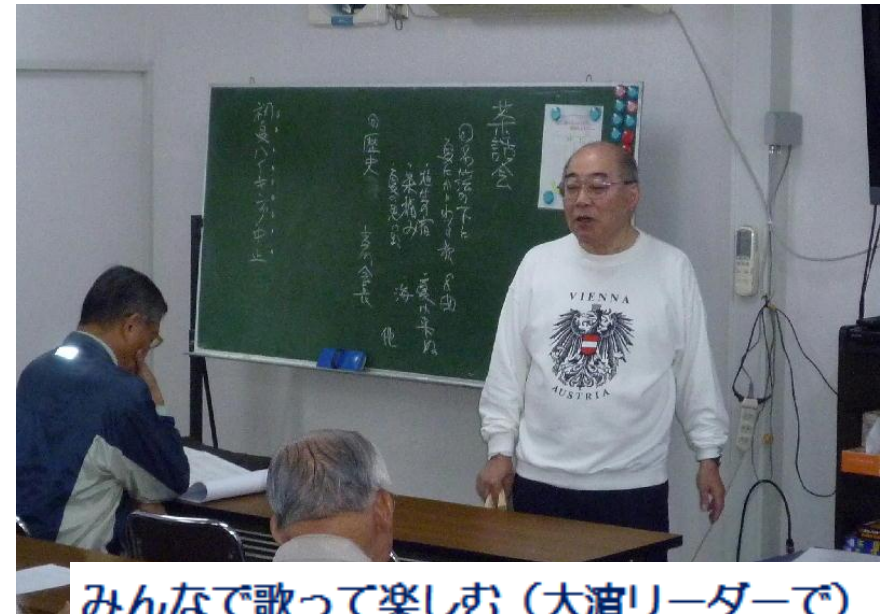
みんなで歌って楽しむ（大演リーダーで）