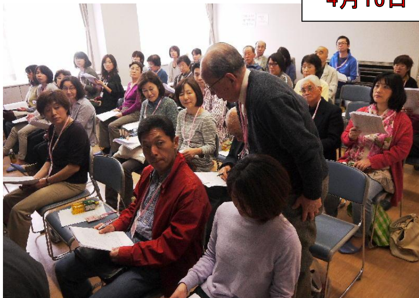
新任の役員 班長さんの紹介