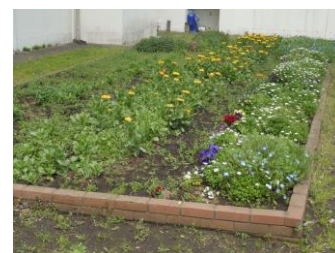
綺麗に咲いた4月の「花だん」